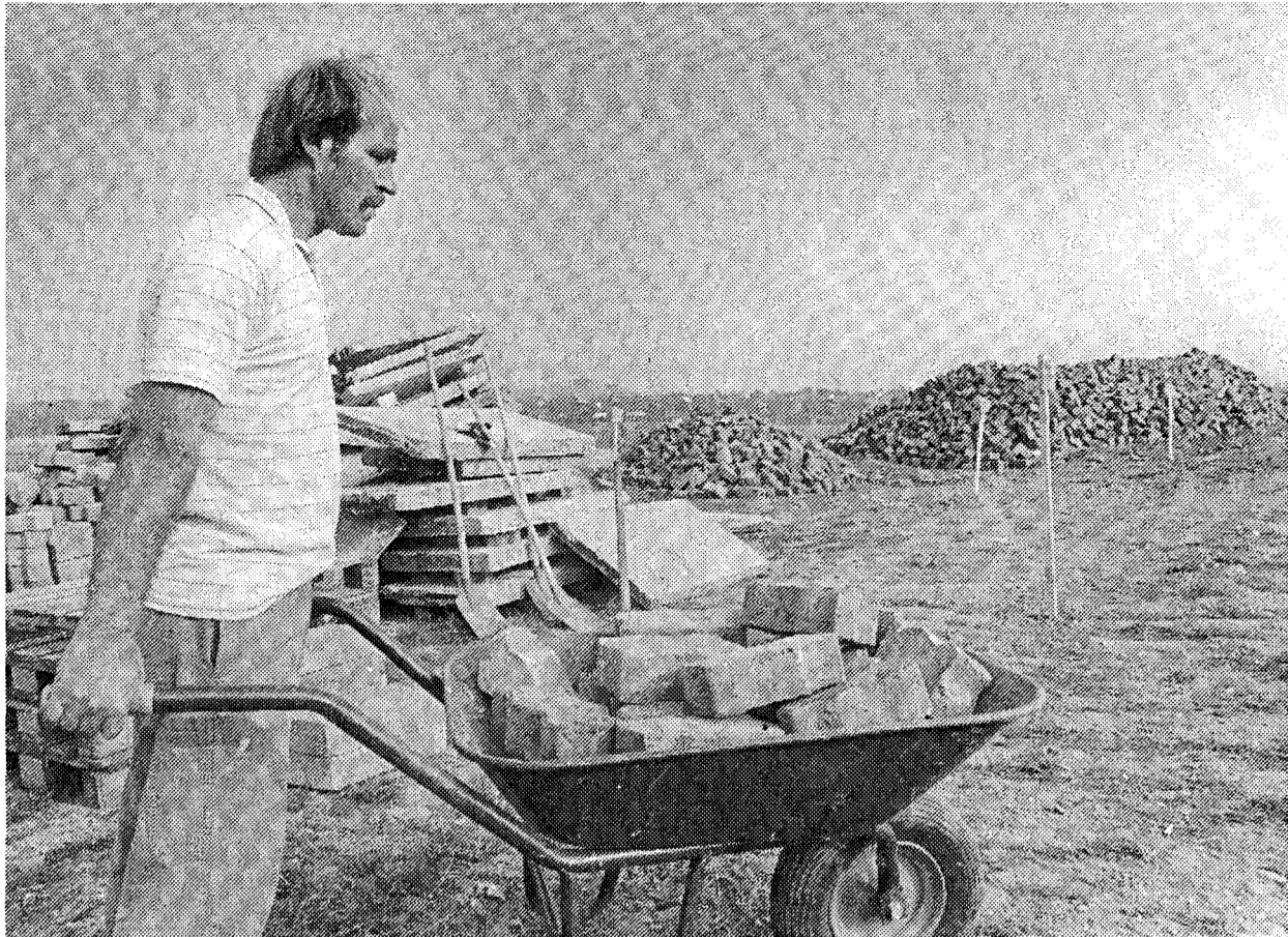
Von Ziegelsteinen bis hin zu Betonplatten und von Verbundsteinpflaster bis hin zu Blumenkästen reicht das Angebot der Kreis-Baustoffbörse, die gestern in Weimar eröffnet wurde.